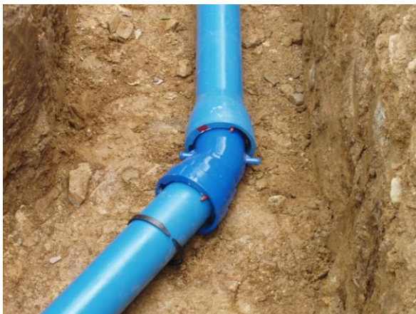
Obr. 1 Aplikace jednohrdlového kolene MK30°

k ušetření financí v rámci celé stavby. Jednoduchost a rychlost pokládky díky jištěným spojům BLS® umožňovala instalaci potrubí tzv. svépomocí. Dle hesla nasad' a zajisti, byla montáž prováděna samotným investorem za pomoci vlastního personálu. Tímto došlo k ušetření dalších nemalých finančních prostředků.