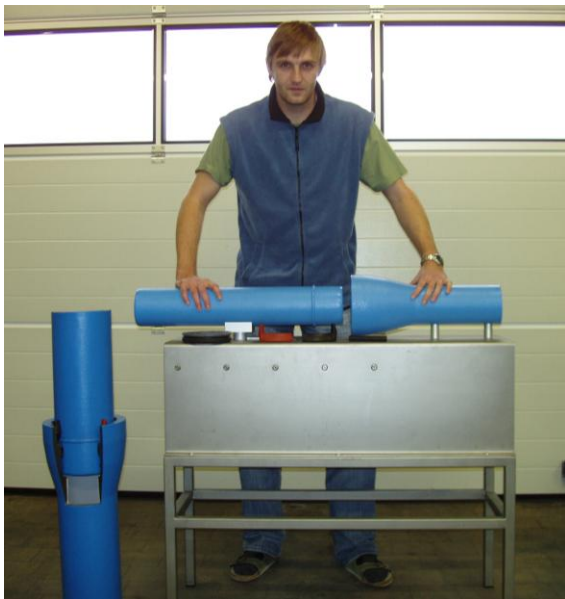
Obr. 1 Model jištěného spoje BLS

odpovídající firmě Duktus. Naši pracovníci se taktéž pohybují v terénu a asistují pracovníkům stavebních firem při provádění pokládky potrubí značky Duktus. Pro projektanty je dále k dispozici celý sortiment našich tvarovek ve formátu dwg a ke stažení speciální software umožňující vypracování kladečského plánu. Tento servis je samozřejmě bezplatný.