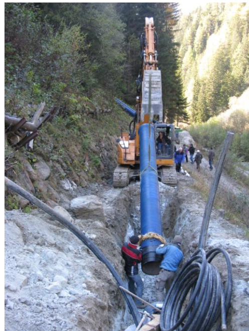
Obr. 4 Pokládka potrubí OCM/ZMU