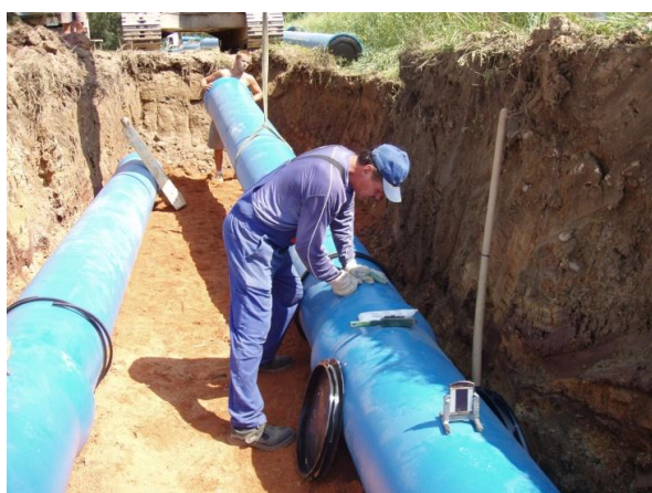
Obr. 1 Ukládání trub

výtlačných řadů DN 500 v území od ul. Na Chmelnicích do vodojemu Sylván v celkové délce 2500 m. Vodovodní řady byly realizovány s pískovým podsypem. Pokládka díky násuvným spojům Tyton a jištěným spojům Tyton BLS® probíhala v rychlém tempu tak, aby neomezovala sklizeň z přilehlých polí. Vodovodní řady jsou navrženy na provozní tlaky 6-8 bar.