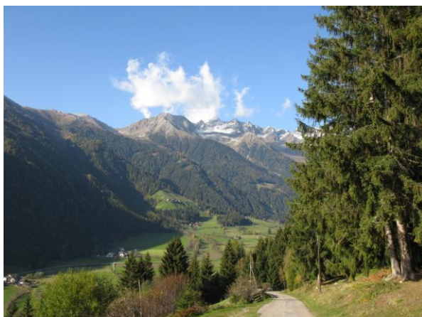
Obr. 3 Panoramatický pohled do okolí