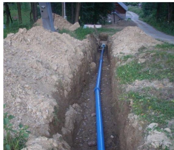
Obr. 2 Pohled směrem na čerpačí stanici – odklon v hrdlech