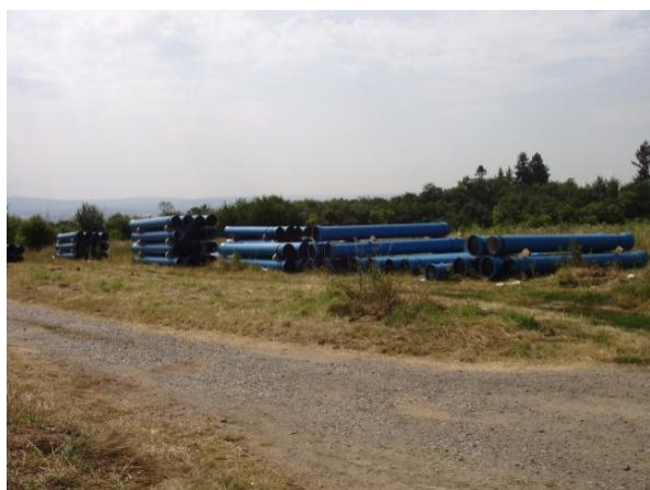
Obr. 3 Skladování trub