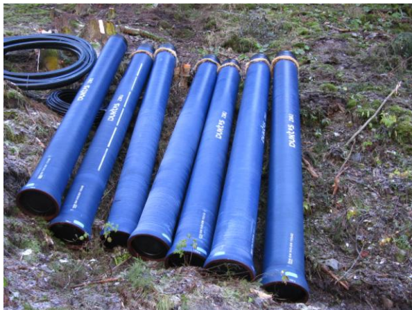
Obr. 2 Skladování trub v terénu

kamenivem až do 100 mm své zrnitosti, což je v takto špatně přístupných terénech nespornou ekonomickou výhodou. Potrubí je o celkové délce 1700 m navržené na tlak 30 bar.