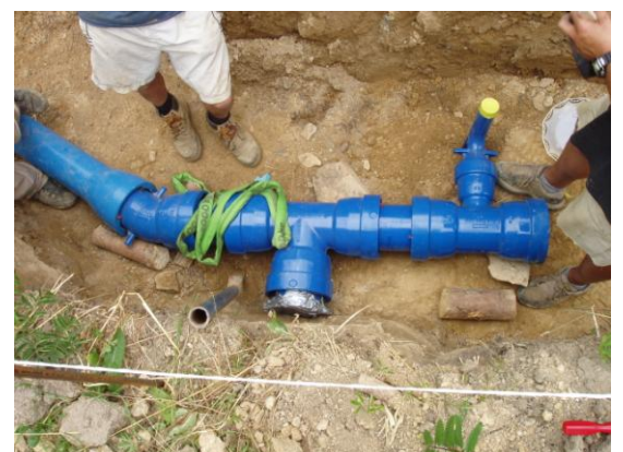
Obr. 4 Použití kolene ENH pro napojení hydrantu