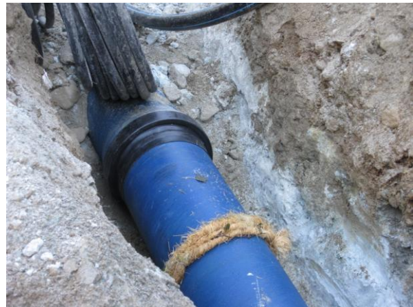
Obr. 1 Uložení trub do výkopku bez podsypu