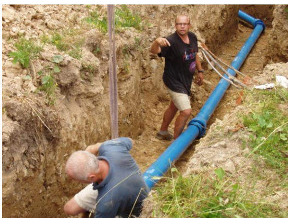
Obr. 3 Realizace svépomocí